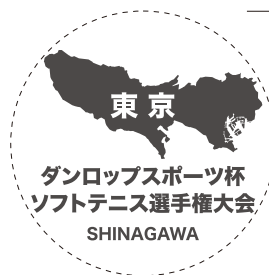
〈オリジナルマーク原寸見本〉