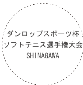
〈ゴシック体原寸見本〉

※文字が潰れそうな場合は弊社で調整する場合があります。 ※マークやネームの商標及び著作権についての責任は 全てお客様に帰属しますので予めご了承願います。